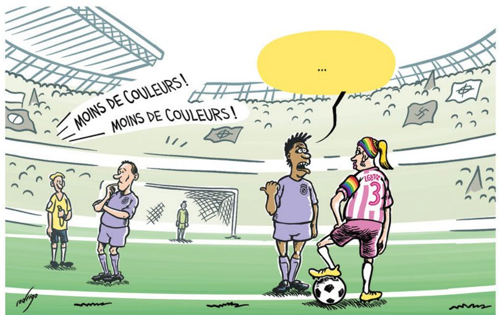
D'après Rodrigo (Portugal) - 2023

Imagine un texte pour la bulle de ce dessin de Rodrigo :