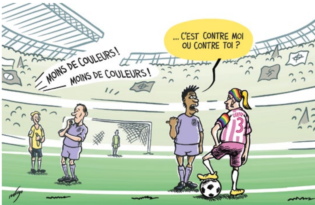
Rodrigo (Portugal) - 2023