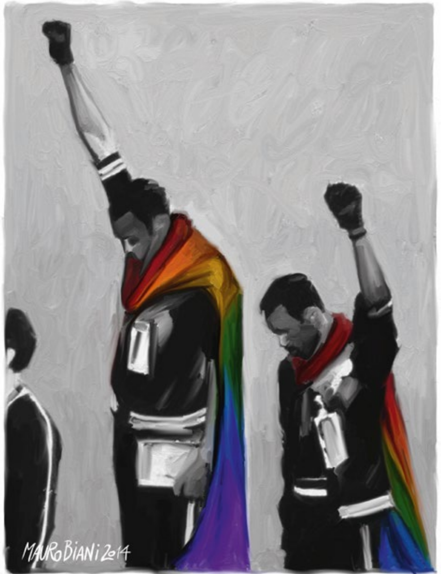
Mauro Biani (Italie) - 2014

À l'origine, les deux sportifs ne portaient pas de drapeau autour du cou. Le dessinateur Mauro Biani a choisi de le rajouter, lorsqu'il a réalisé ce dessin en 2014, au moment des Jeux Olympiques d'hiver à Sotchi, en Russie.