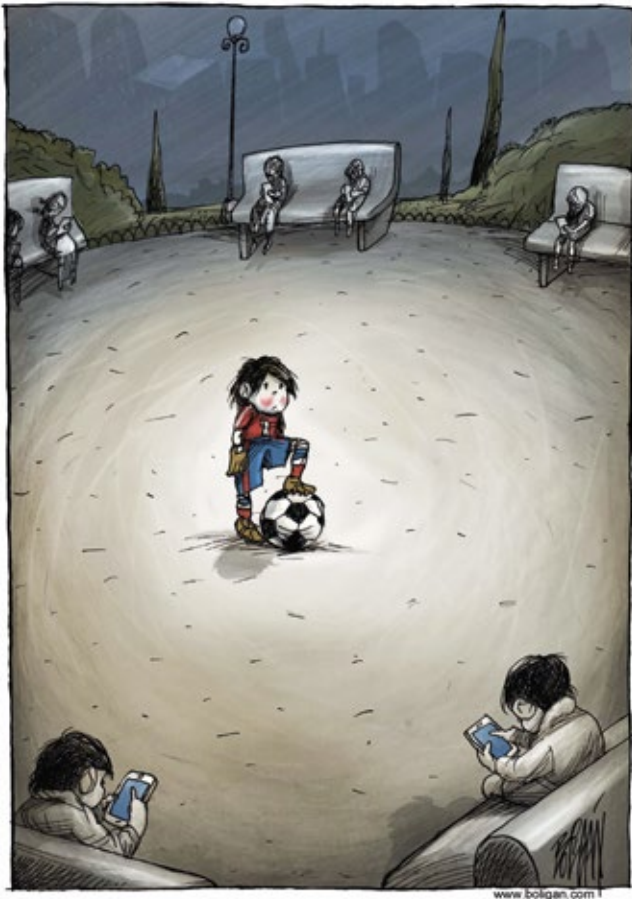
Boligán (Mexique) - 2017

À ton avis, que pourrait dire le personnage au centre de ce dessin de Boligán ? Imagine le texte d'une bulle !