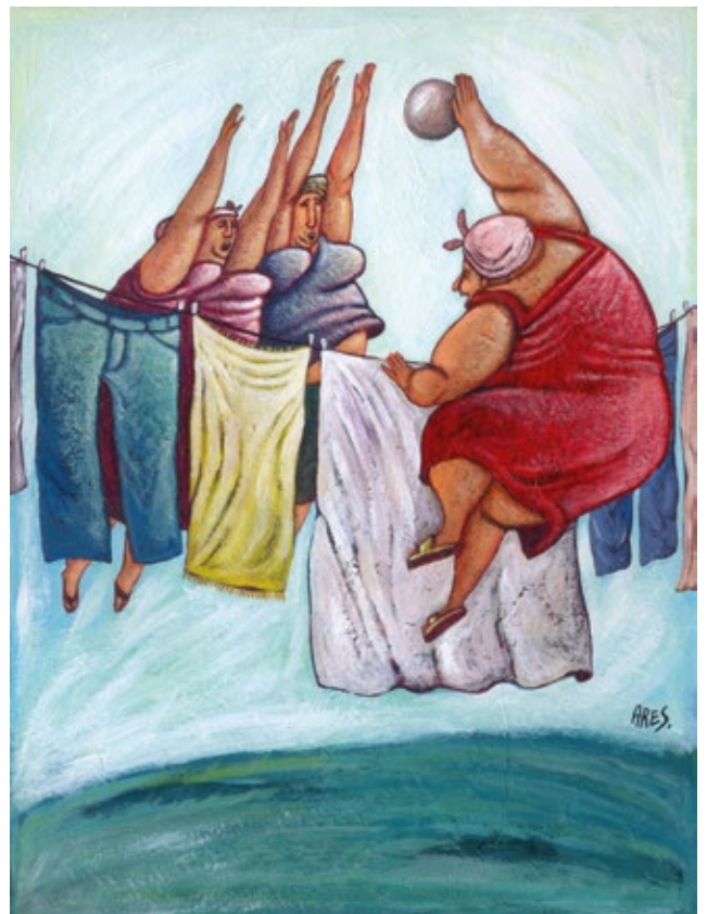
Ares (Cuba) - 2019

Quel pourrait être le titre de ce dessin d'Ares ? Imagines-en un !